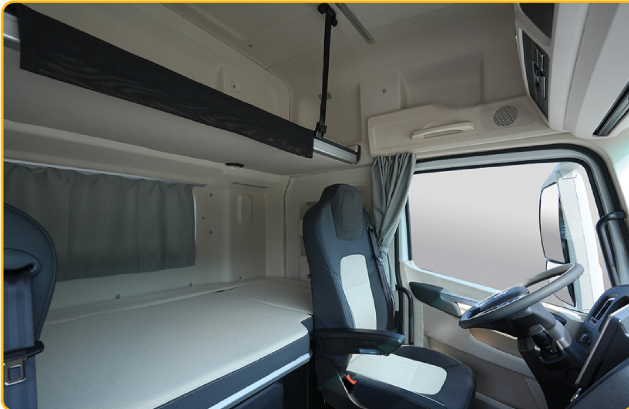
تخت خواب بزرگ