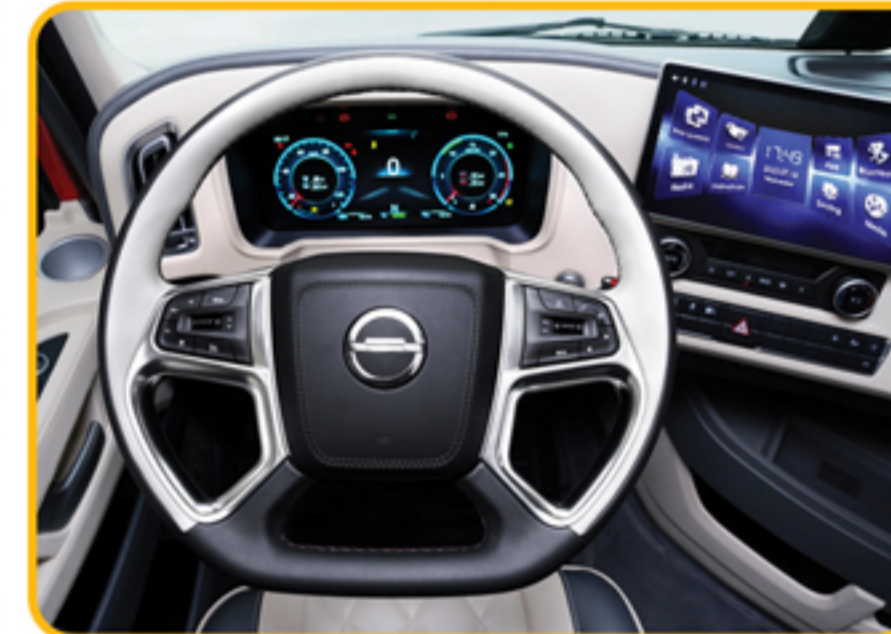
غریبک فرمان مجهز به کلیدهای دسترسی به مولتی‌مدیا و کروز کنترل