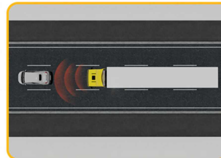
سیستم ترمز اضطراری هوشمند (AEBS)