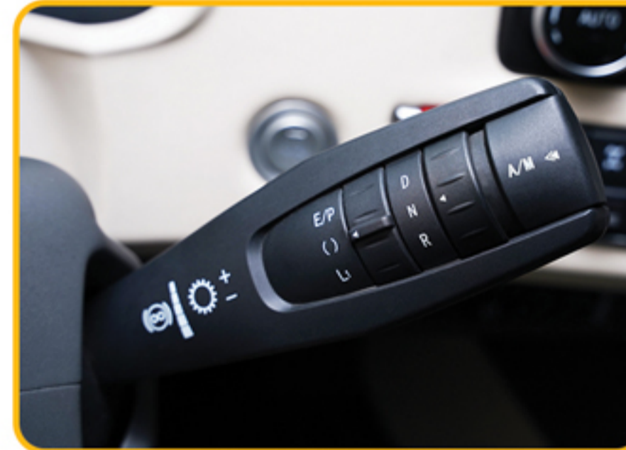
دسته تعویض دنده پشت فرمان