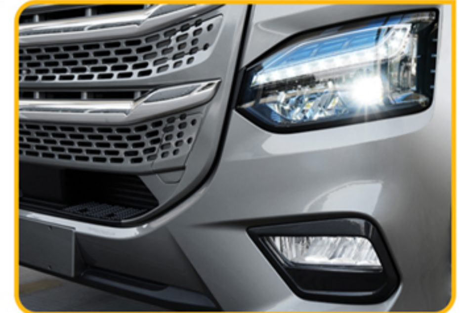
چراغ‌های جلو با تکنولوژی FULL LED