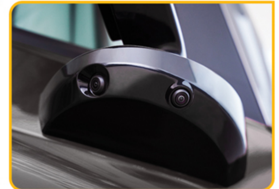
دوربین ۳۶۰ درجه به همراه سیستم رادار تشخیص نقاط کور (BSD)