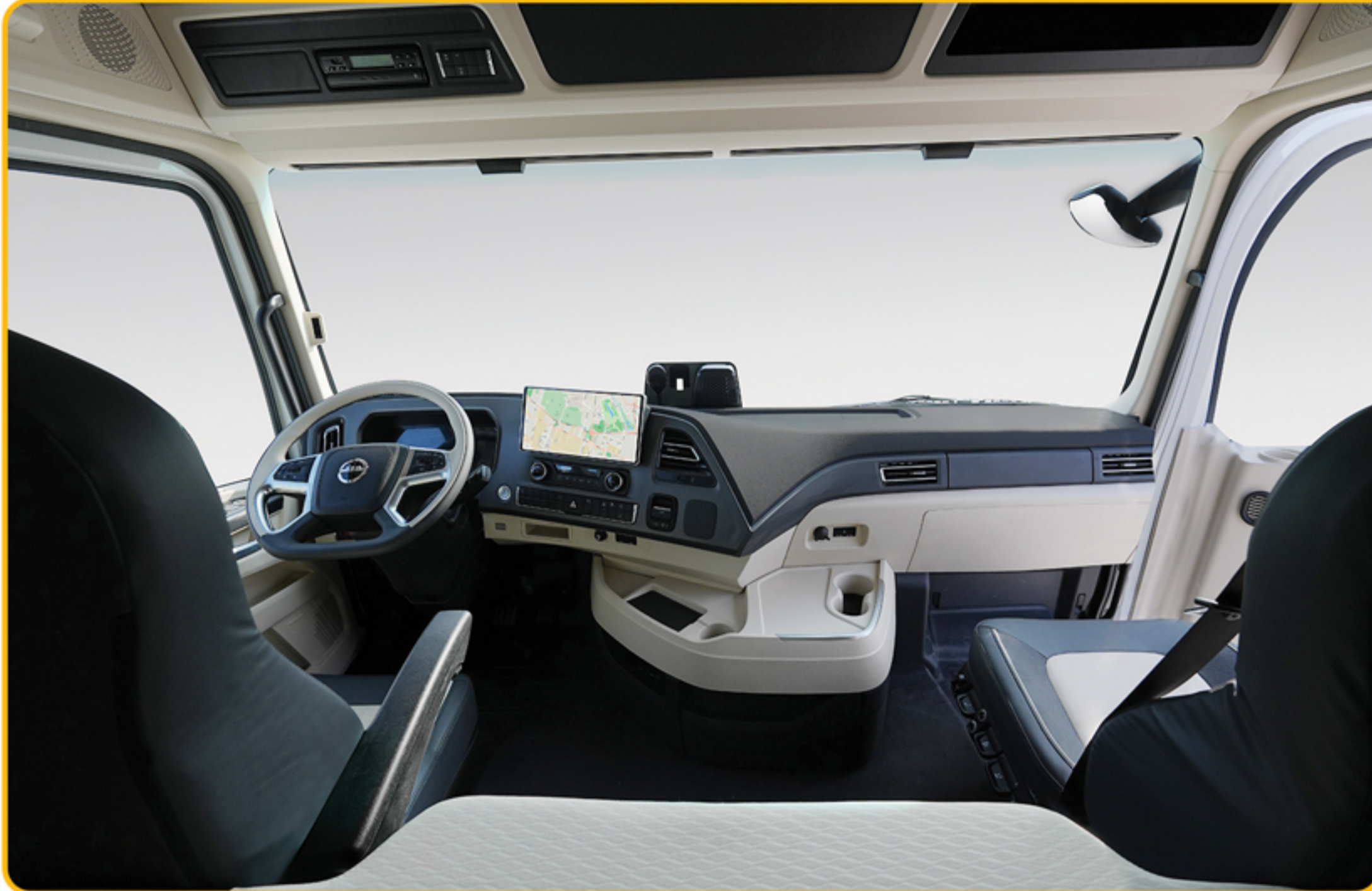
کابین بزرگ، ارگونومیک و مدرن به همراه سیستم مولتی‌مدیا ۱۳٫۵ اینچی TFT لمسی (رادیو، رهیاب، بلوتوث، USB، SD Card)