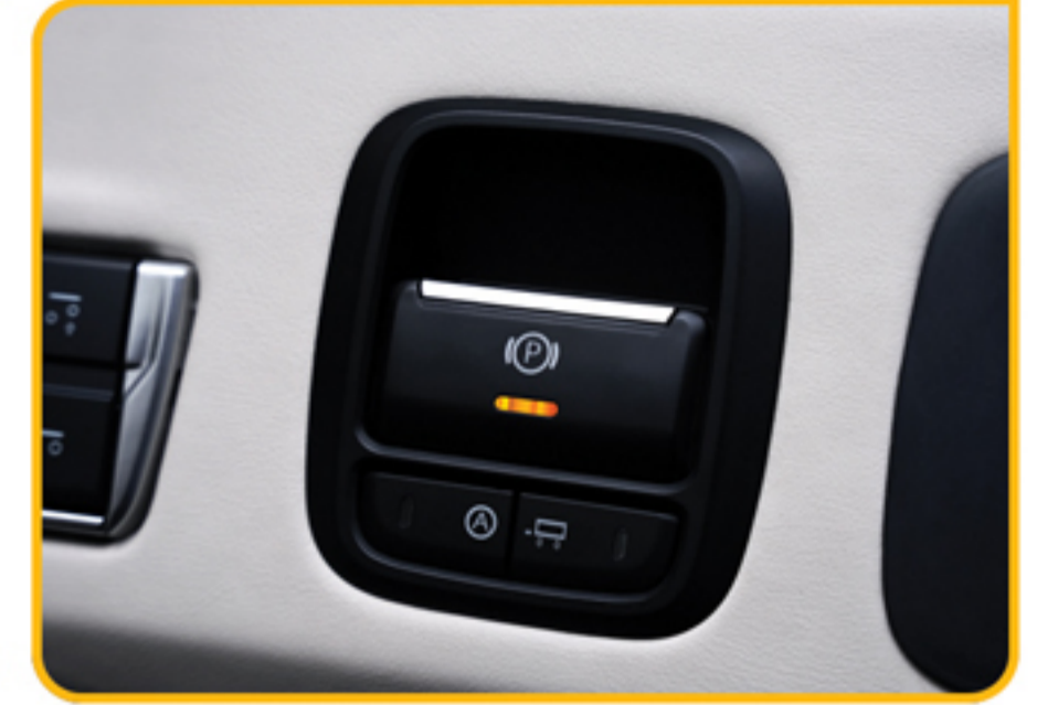
ترمز پارک برقی (EPB)